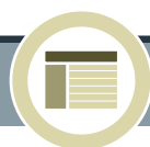
Cuadro XV.3 Disposiciones constitucionales y acciones legales relacionadas con la discriminación y las poblaciones afrodescendientes en América