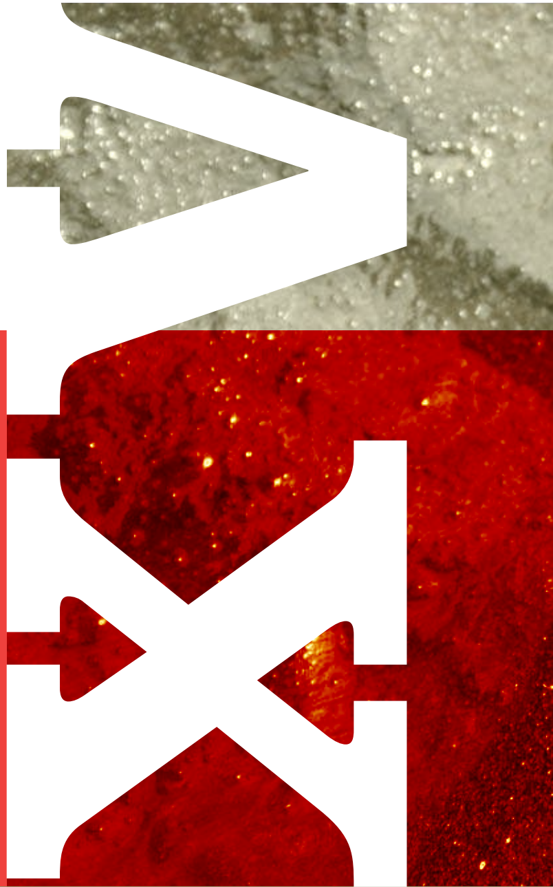
Los oritos en la batea, Suarez, Cauca, 2006.