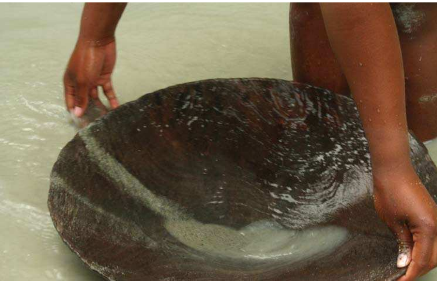
El mazamorreo del oro, Suarez, Cauca, 2006.

vistas de las organizaciones y académicos, principalmente, en el campo de la investigación de temas de cultura y política, así como la creciente articulación de expresiones artísticas a las luchas políticas; es el caso de la capoeira en Brasil, el reggae en el Caribe, la saya en Bolivia y las músicas del litoral Pacífico en Colombia, entre otras. En estos casos, la revitalización de expresiones artísticas como las músicas, bailes y artesanías contribuye a resignificar el valor de las expresiones culturales de los afrodescendientes. Este tipo de procesos ayuda a generar dinámicas de reconocimiento cultural básico (CCARC s.f.:12-14), en las que la acción política se orienta hacia la autoidentificación de las poblaciones negras, buscando superar los sentimientos de desarraigo cultural producto del racismo y las ideologías de mestizaje, al tiempo que se busca un reconocimiento formal por parte del Estado y sus instituciones (reconocimiento interno y reconocimiento externo).