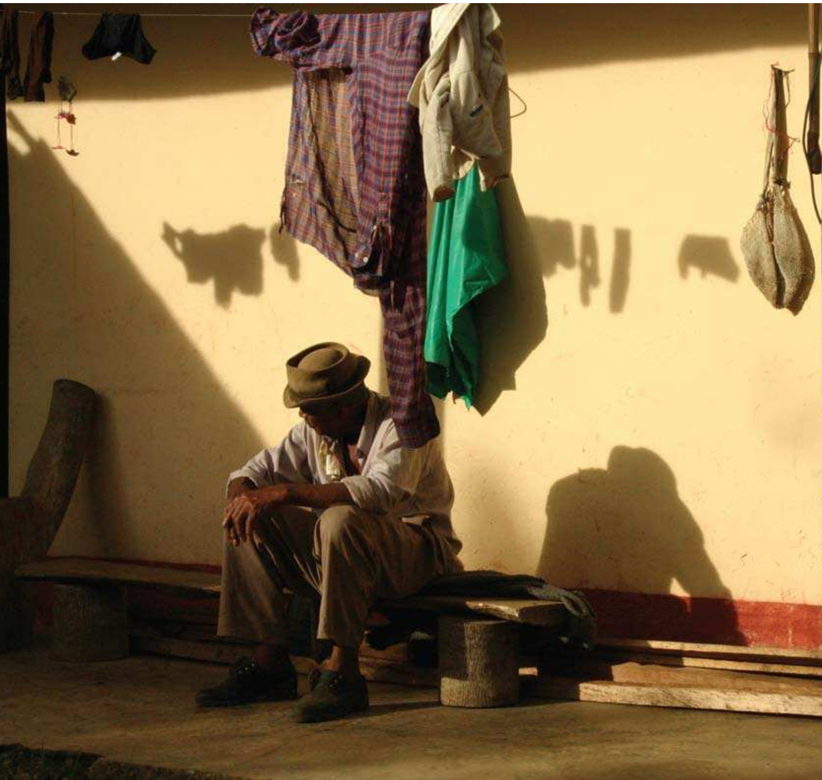
Agricultor luego de jornada de trabajo , Suarez, Cauca, 2006.