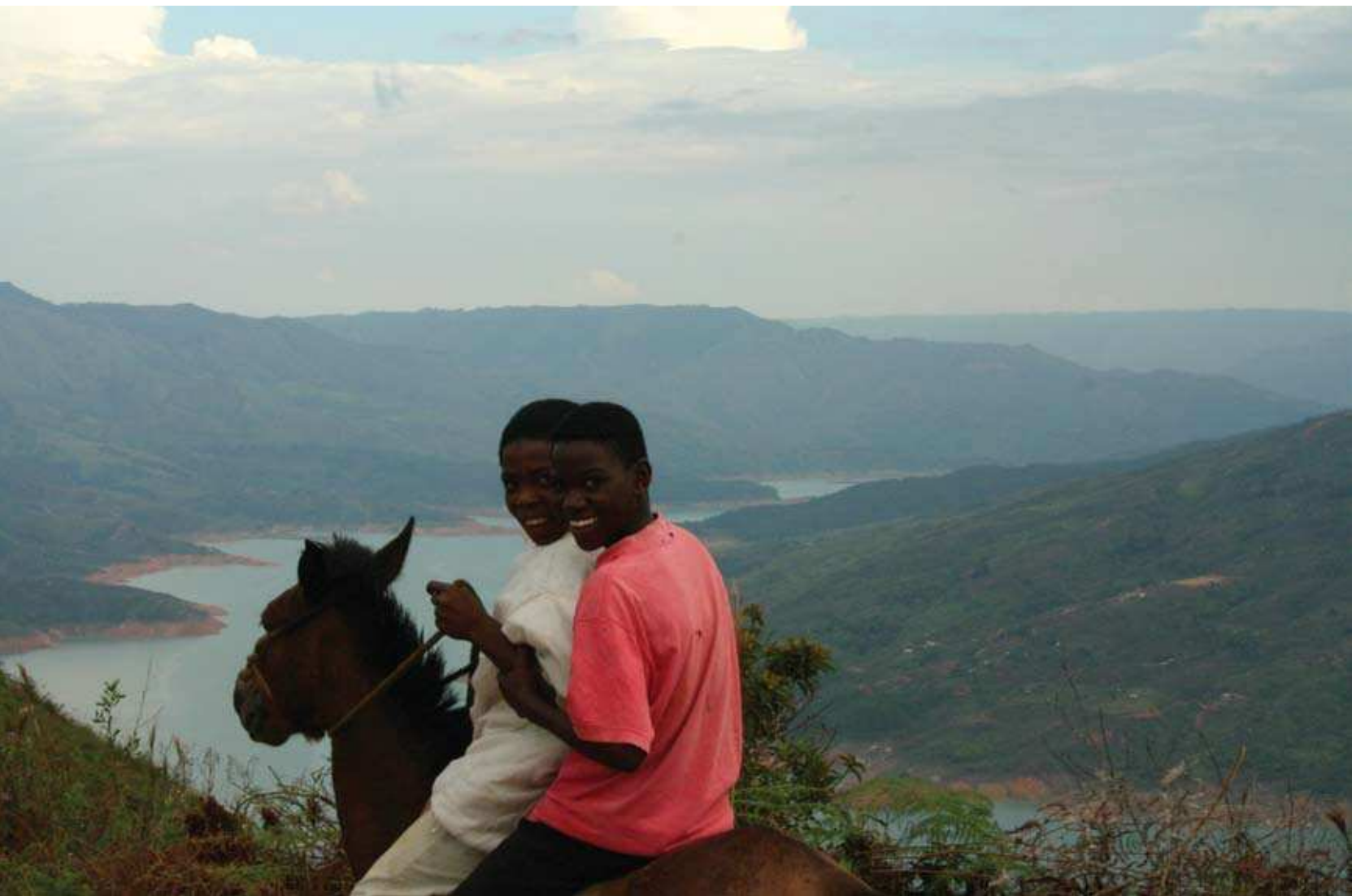
Jóvenes a caballo, Suarez, Cauca, 2006.

Un caso emblemático de esta forma de resistencia lo encontramos en Colombia, en uno de los palenques más significativos de la región: el de San Basilio, primer lugar reconocido libre por la Corona española en América Latina. El Palenque de San Basilio fue reciente-