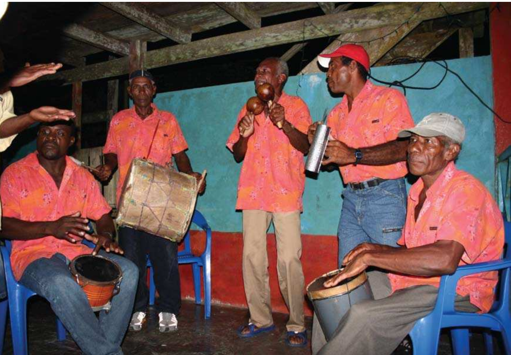
Músicos de Nuqui, Chocó, 2008.

Ahora bien, es importante insistir en que la sola presencia o peso porcentual de la población no es suficiente para comprender las condiciones de vida actuales de los afrodescendientes en una sociedad. Los sistemas políticos y los marcos jurídicos nacionales, las formas de organización política de los